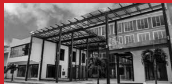
Edificio Bolívar - Santa Cruz Arq. Juan Pablo Martínez