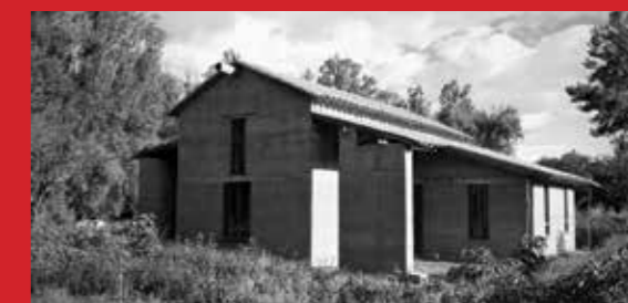
Casa T - Tarija Arq. Mechthild Kaiser Arq. Mauricio Méndez